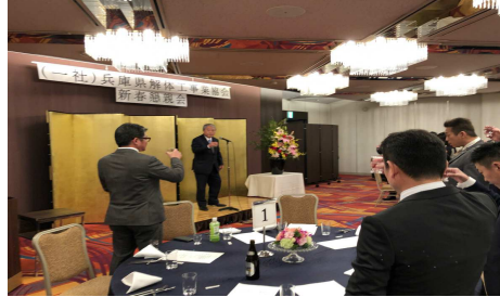
乾杯の音頭をとる金顧問